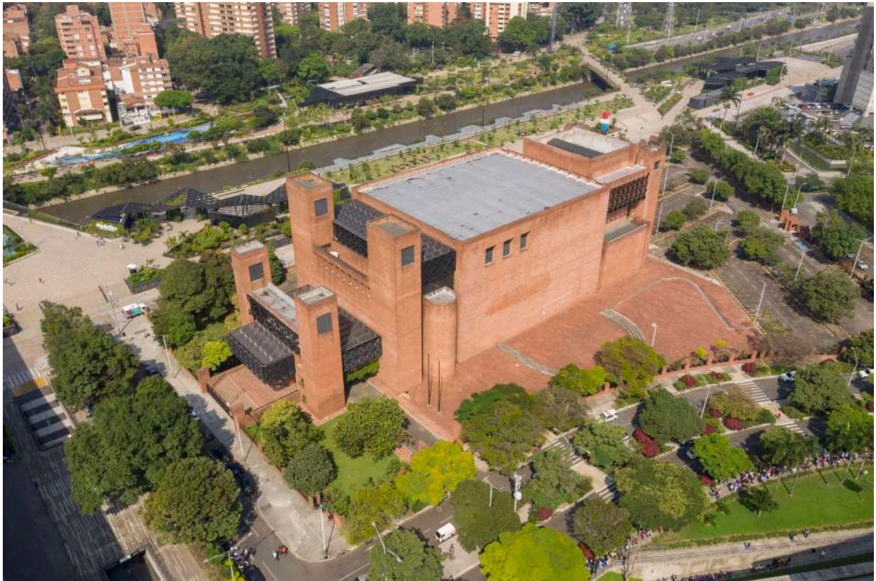
Vista aérea del Teatro Metropolitano y su entorno.