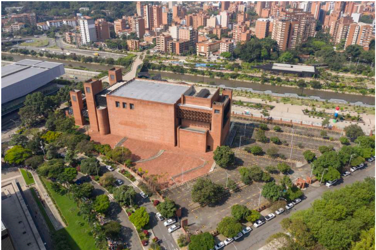
Vista al costado oriental del Teatro Metropolitano y su entorno.